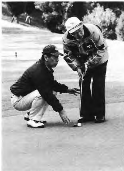
▲パートナーのアドバイスを受ける視覚障害者

この大会で集められたチャリティ募金は(財)日本盲導犬協会、神奈川県視覚障害ゴルフファースト協会、かながわと