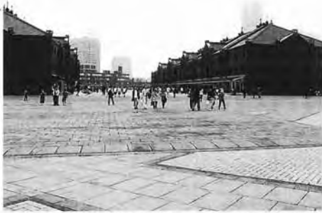
▲横浜観光名所のひとつ「赤レンガ」