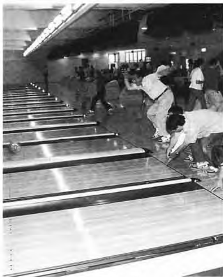
▲ボランティアの介助でゲーム開始

スルーネット・ピンポン 関東地区大会が神奈川県内 で行なわれました。関東1 都5県から50名の選手が集 まり2日間にわ たって白熱した 試合が繰り広げ られました。ス ルーネットピン ポンは通常の卓 球台の四隅を一 部加工したもの を使用し、鉛の 入った専用のピ ンポン玉を中央