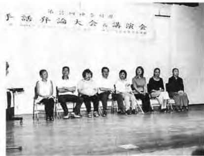
参加された弁士の皆さん▲