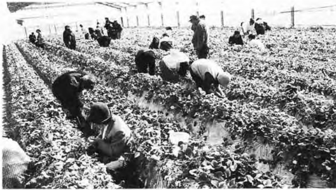
ビニールハウスの中はポカポカ陽気▲