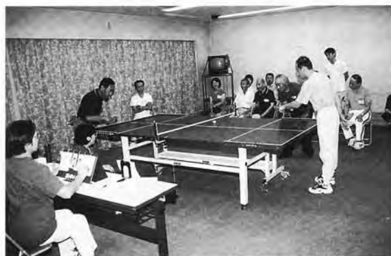
3ブロックに別れ3会場で行なわれました▲

のネットの下をころがして 打ち合います。青眼者も参 加可能なためプレイ人口も 徐々に増え、各県で人気が 高まっているそうです。