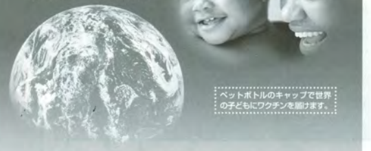
ペットボトルのキャップで世界の子どもにワクチンを届けます。

ゴミとして廃棄されると キャップ400個で3,150g のCO 2 が発生します。